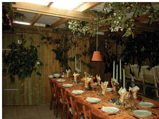
Cykelskuret bliver festligt udsmykket inden naboernes fest.