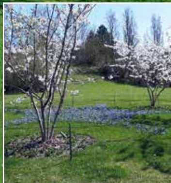
Ved den store plæne