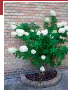
Gurrevej ved indgang