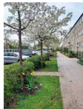
Arn. Nielsens Blv.